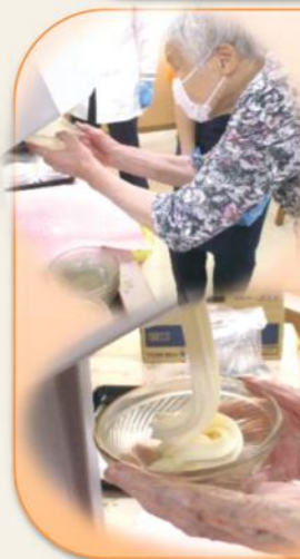
【8月:ソフトクリーム】

今年の夏も暑かったですね！そんな暑さの中、リハビリで疲れた体を癒してくれたのは、みなさんお待ちかねのおやつタイム☆ その中でも特に人気なのが1年に1度、この時期だけしか登場しないソフトクリーム！実際にみなさんにお皿を持っていたき、機械から出てくるソフトクリームをバランスよく、キャッチして頂きました♡