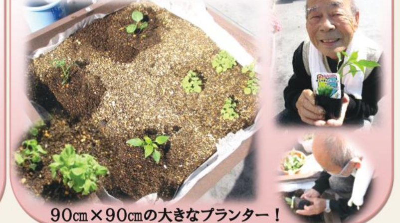
90cm×90cmの大きなプランター！

夏に向けて、ピーマン、ナス、ミニトマト、大葉と夏野菜を育てていきます！野菜作りの経験がある方は、指導&アドバイスお願いします(*´▽`*)