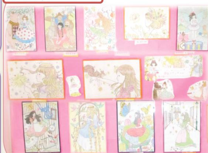
彩鮮やかな、素敵な作品ばかりですね(*´艸`*)