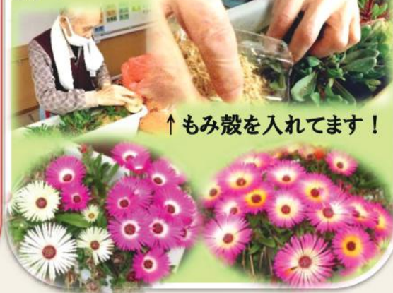
↑もみ殻を入れてます！

利用者様から頂いた「リビングストーン」、色鮮やかな花をたくさん咲かせていきます！